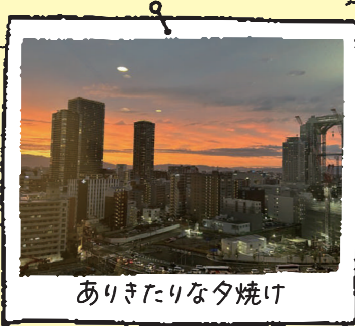
ありきたりな夕焼け

手術の翌日にカテーテルが取れ、頑張って動いて撮ったものです。2週間の入院中は、子どもや友人に会えず、安静のためベッドから動けないなど、縛りのある生活でした。この日の夕焼けを見たとき、手術が無事成功して体が動く自由さや、人の温かさに触れて感動しました。日常が当たり前ではないと実感し、いろいろな思いが混ざり合って泣いた日です(笑)