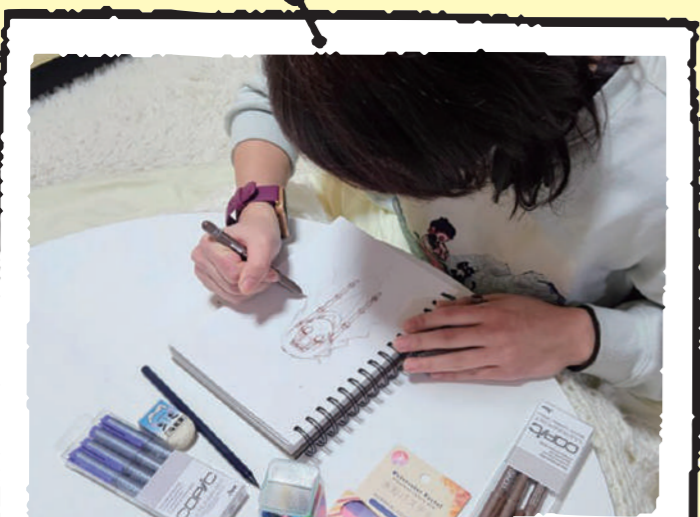
趣味で絵描き、この後こたつの上を散らかす(実家)