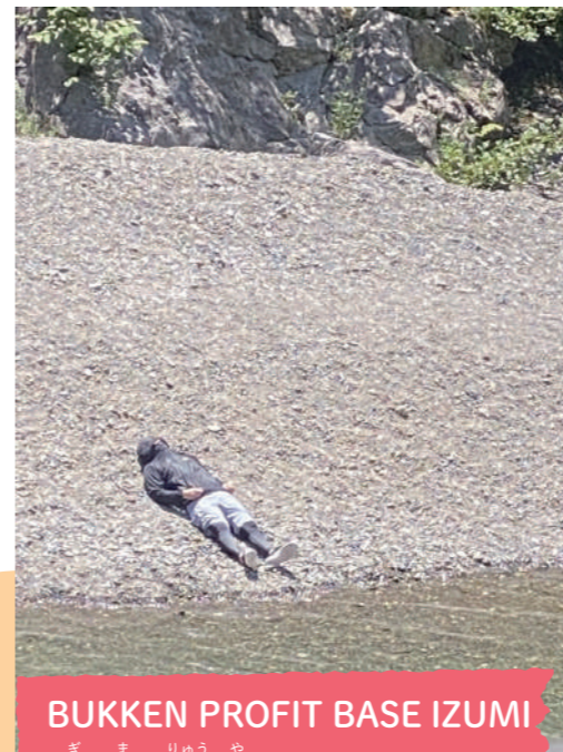
BUKKEN PROFIT BASE IZUMI 儀間 琉哉さん

夏になると、よく友達とバーベキューをしに行きます。バーベキューハウス・コテージ・グランピングテント・ドッグランがあり、家族や仲間同士で存分に楽しめます。ぜひ訪れてみてください。