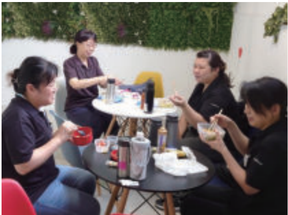
▲仲の良いみんなでランチ♪

仕事でこだわっているのは、自身が担当している商品をよく知ることだ。普段の作業では、化粧品や食品はパッケージされたものを梱包しているため、中身がどのようなものなのかも、