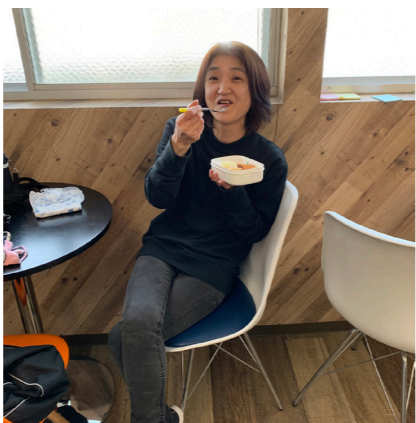
▲美味しい楽しいランチタイム

惑をかけないように、今後も変わらず頑 張っていききたいと思っています」。 入社以来、ストイックな姿勢で業務 にあたってきた池側。今後もパート従 業員の手本となって、物研を支え続け ていこう。